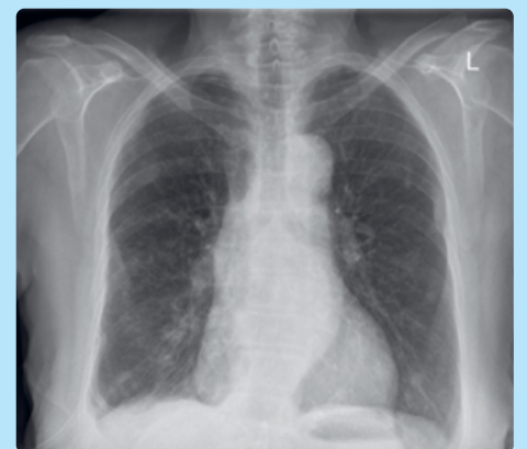
Rechtsseitiger maligner Pleuraerguss nach optimaler Therapie durch eine minimalinvasive Thorakoskopie