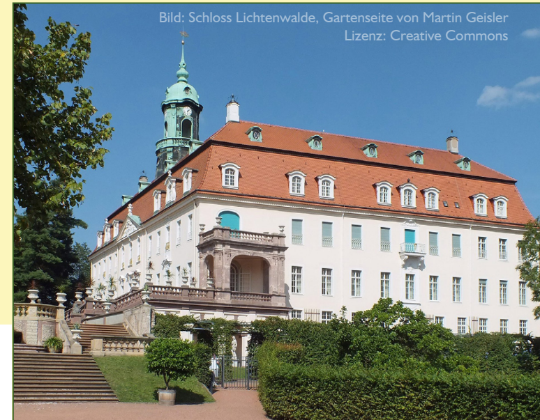
Bild: Schloss Lichtenwalde, Gartenseite von Martin Geisler Lizenz: Creative Commons